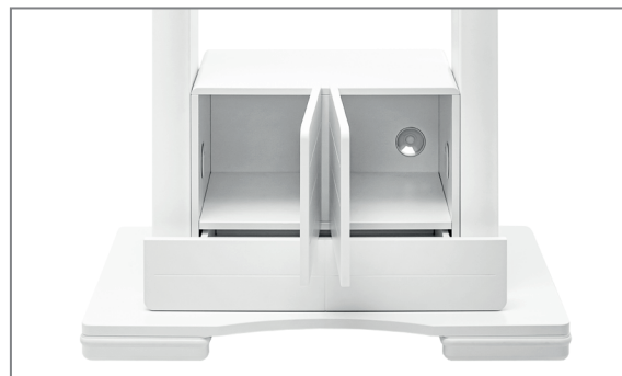
Gut strukturierter, belüfteter Stauraum für Medientechnik