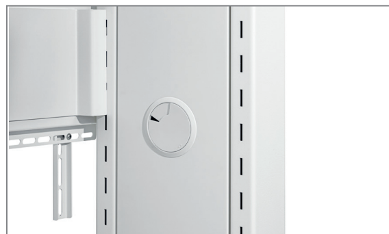
Höhe des Bildschirms wählbar in Raststufen (montageseitig)