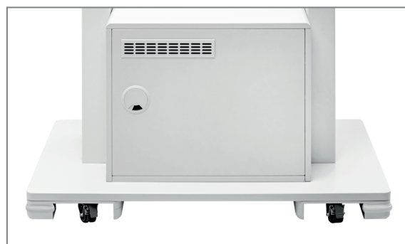
Rückansicht, feststellbare Transportrollen, Belüftungsgitter