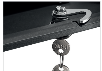
inkl. 2 Sicherheitsschlössern