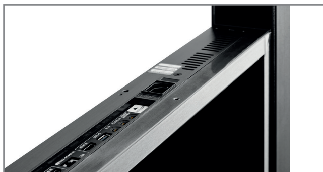
Kabelführung innerhalb des Rahmens und der Tragsäulen