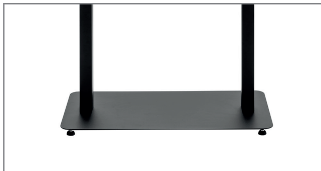
Kippsicherer Standfuß für flexible Positionierung im Raum

Alternativ steht auch eine Variante zur direkten Bodenmontage zur Verfügung. Floormount OM55N-D (Art.-Nr.: 1918)