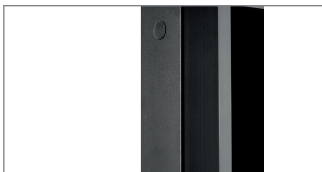
schlag- und kratz-feste Pulverbeschichtung