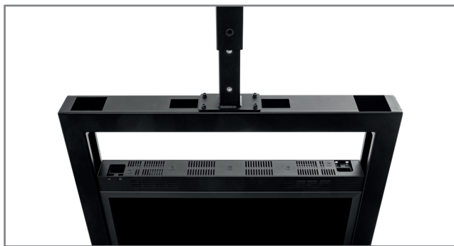
Höhenverstellung über montageseitig einstellbare Raststufen

Die Oberfläche ist im Standard schwarz und mit einer schlag- und kratzfesten Pulverbeschichtung veredelt. Auf Anfrage können auch andere Farbtöne (nach RAL) realisiert werden.