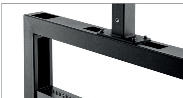
Kabelführung innerhalb des Rahmens