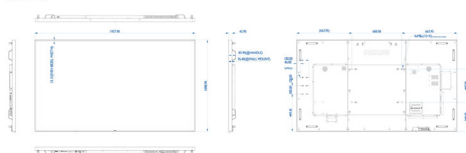
Philips 86BDL4150D Monitor (86 Zoll)